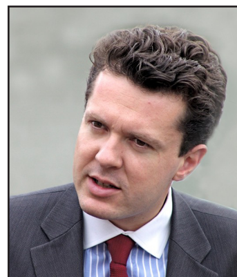
Christophe BÉCHU Président du Conseil Général de Maine-et-Loire

Que l'année 2007, année de la réforme de la protection de l'enfance, soit marquée par le dynamisme et la bonne volonté de tous. Qu'elle soit également celle du développement des projets de l'Oned dans la continuité de son deuxième rapport au Parlement et au Gouvernement.