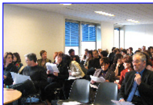
Un public de plus de 70 personnes

L'Observatoire met actuellement en place un dispositif d'observation longitudinale des enfants bénéficiant d'une mesure de protection en France.